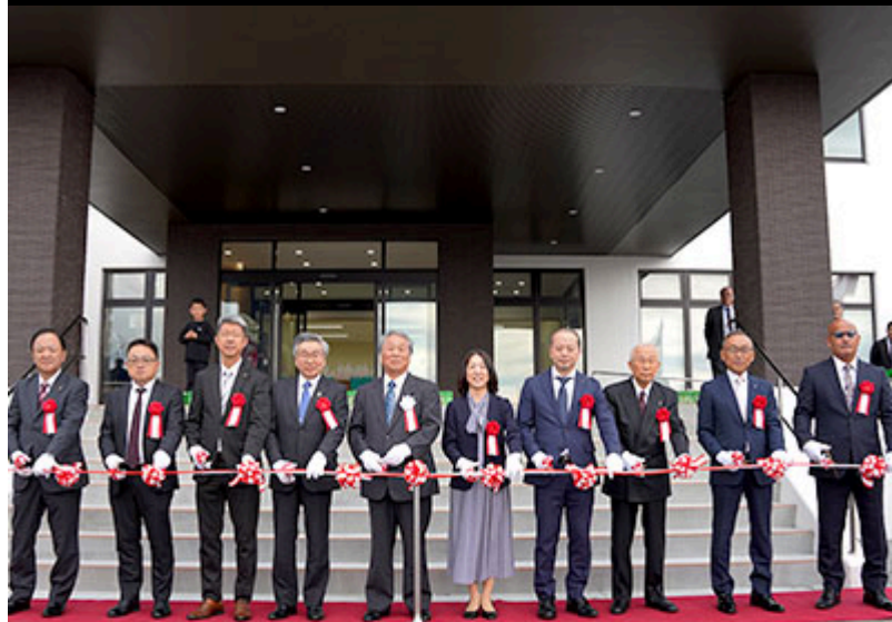
北浦荷捌施設・北浦漁協事務所 竣工式