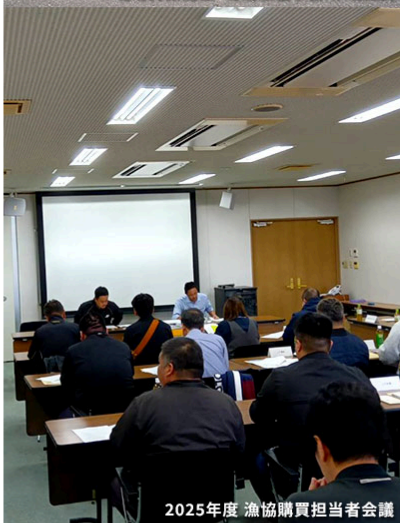
2025年度 漁協購買担当者会議