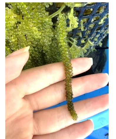
図2 刈取り前の海ぶどう

事業所1ヶ月当たりの取扱量は3.6~25kgであり、取扱合計量は48.15kg/月（通常時23.15kg/月、フェア期間25kg/3日程度）でした。店頭での販売量