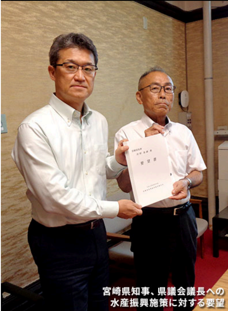
宮崎県知事、県議会議長への 水産振興施策に対する要望