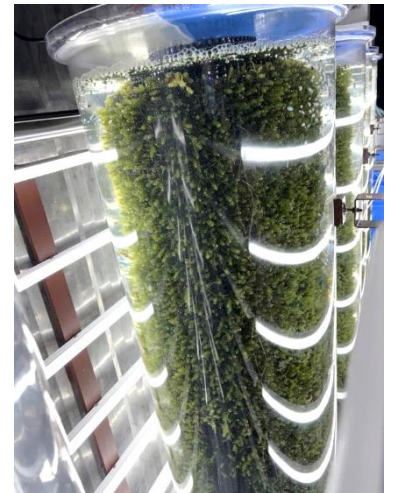
図1 養殖中の海ぶどう

宮崎県漁連が県内で初めて導入した海ぶどう陸上養殖は、右の図のような円柱型的水槽を利用しています。面積を取らないため、狭いコンテナハウスの中でも十分な量を生育することができます。また、人工海水を利用しており、水温、pHなどの調整も行っているため、水質を一定に保つことができます。天然海水と異なり、不純物が混ざることがないので清潔な状態です。