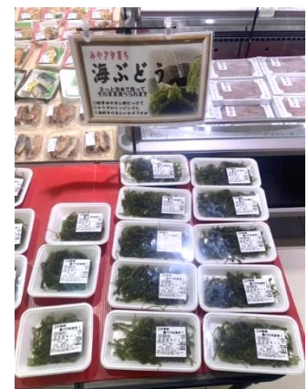
図3 販売されている海ぶどう (令和7年8月11日)

宮崎県漁連では7月下旬から海ぶどうの出荷を開始し、県内のスーパーで「宮崎産海ぶどう」として販売されています。また、県内での生産ですので新鮮な状態で店頭に出ることが魅力です。サラダや刺身のトッピングなど、様々な料理に合わせられます。皆様、見かけることがありましたら、ぜひとも宮崎県内初の海ぶどうを手にとっていただき、ご賞味ください。