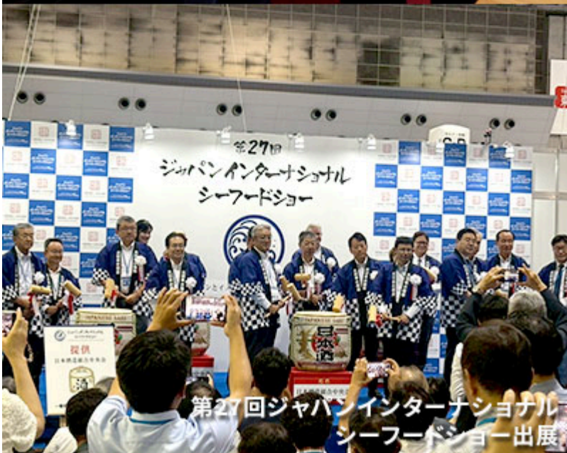
第27回ジャパンインターナショナル シーフードショー出展