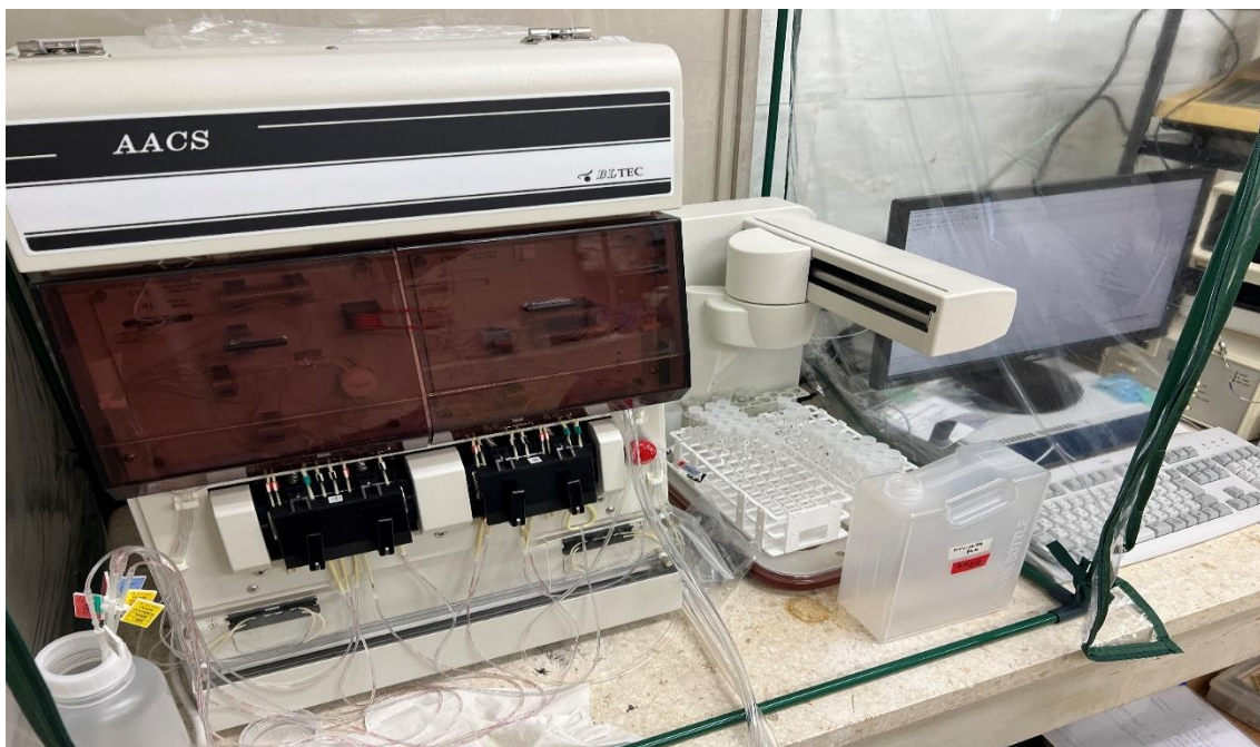
図2. オートアナライザー