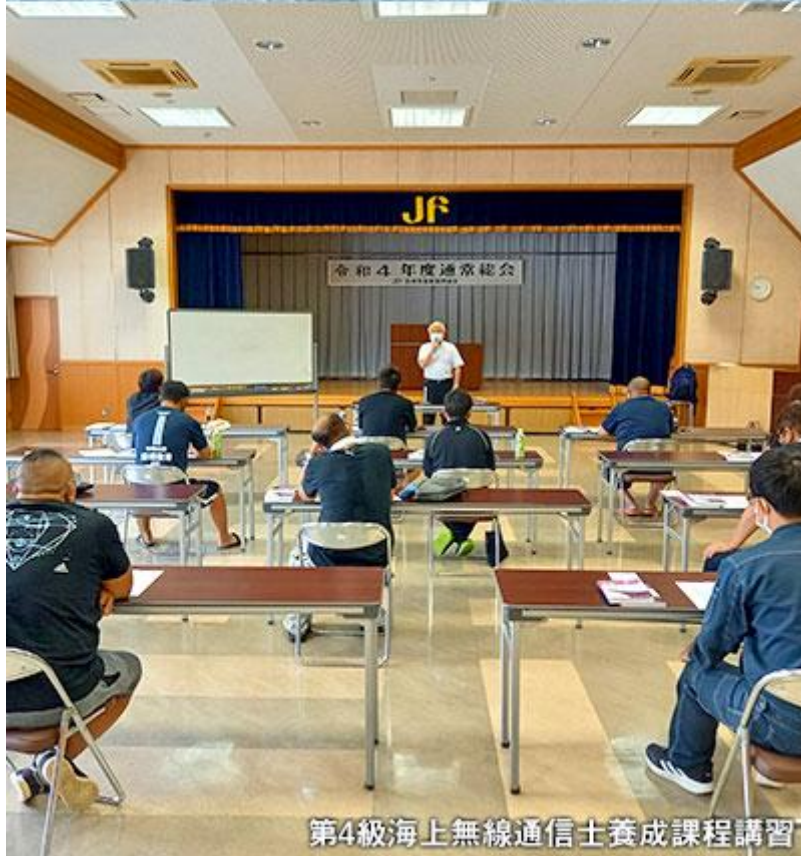
第4級海上無線通信士養成課程講習