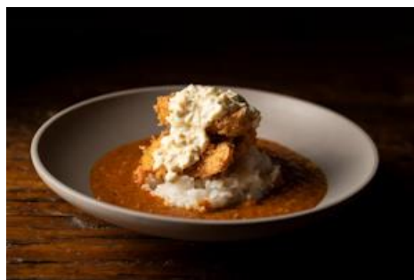
へべすぶりのカツカレー