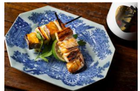
へべすぶりの串焼き