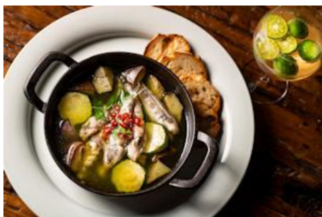
メヒカリのアヒージョ