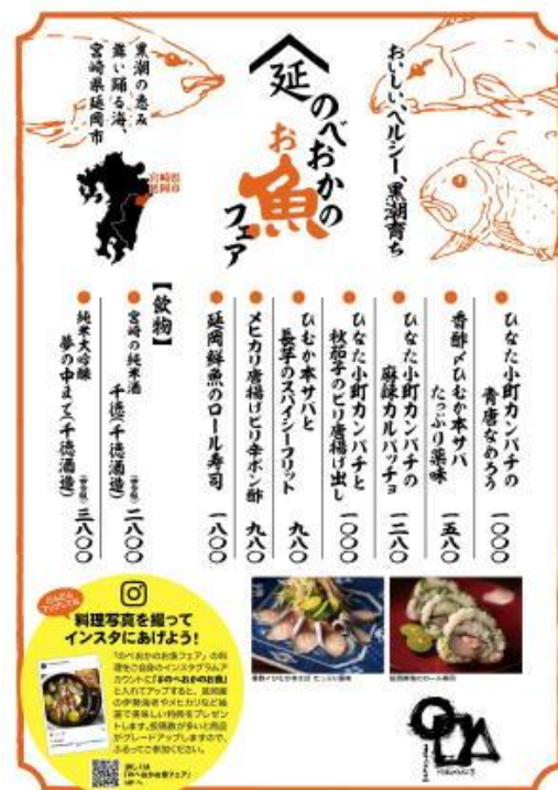
店舗の特製メニュー