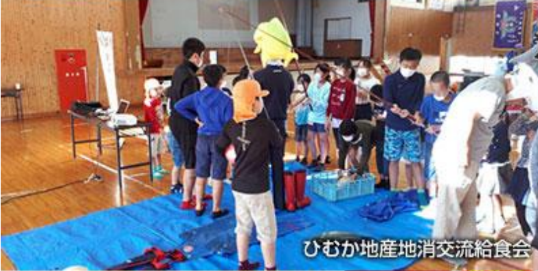
ひむか地産地消交流給食会