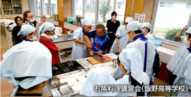
お魚料理講習会(飯野高等学校)