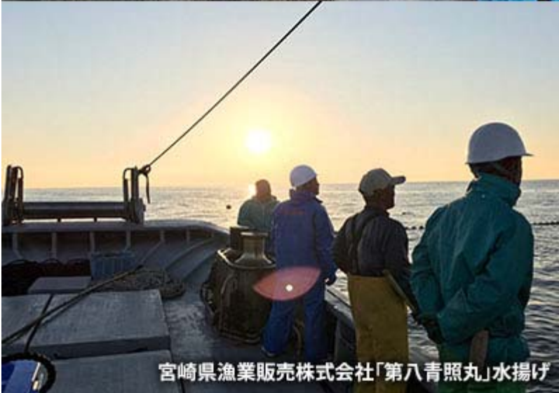
宮崎県漁業販売株式会社「第八青照丸」水揚げ