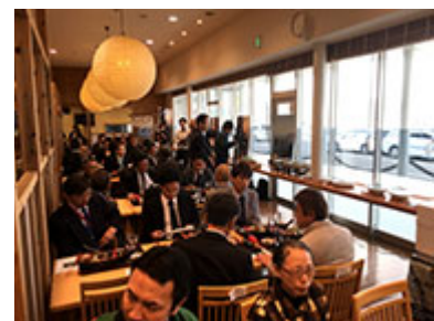
マスコミ向け試食会(H29,4,27)