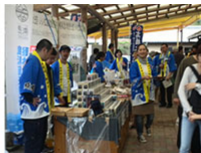
テスト販売の様子 (5/4:延岡市)