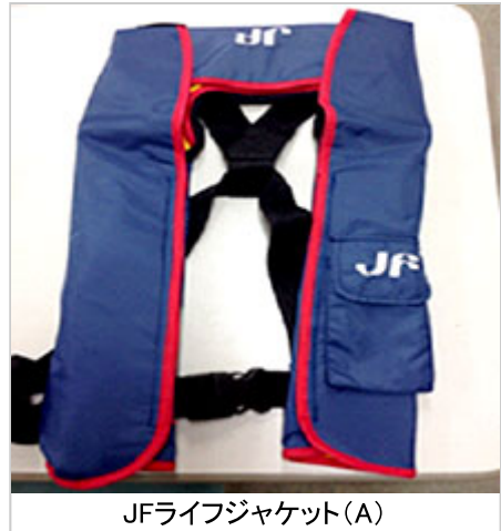
JFライフジャケット(A)

JF宮崎漁連では、多数の救命胴衣を取り扱っておりますので、購入の際は【本所・購買事業部/延岡支所/日南支所】まで連絡をお願い致します。