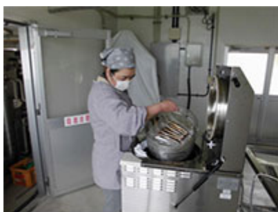
高温高圧蒸気殺菌機でのレトルト品製造