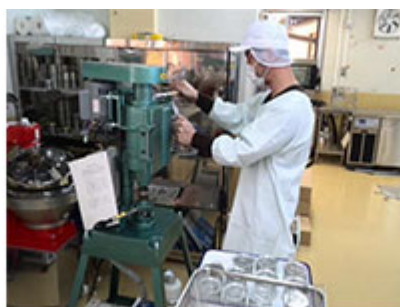
真空巻締機を使った缶詰め作業