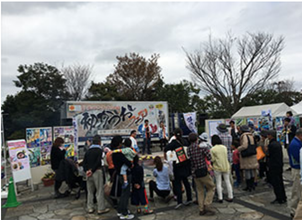
多くの皆様に集まっていただきました

また、各地で「宮崎初かつお」の振る舞いも開催しており、4月2日(土曜日)には、宮崎市フローランテ宮崎で、宮崎おさかな普及促進協議会と合同で振る舞いイベントを開催しました。