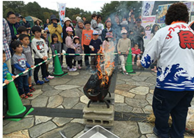
かつお「焼き切り」実演中