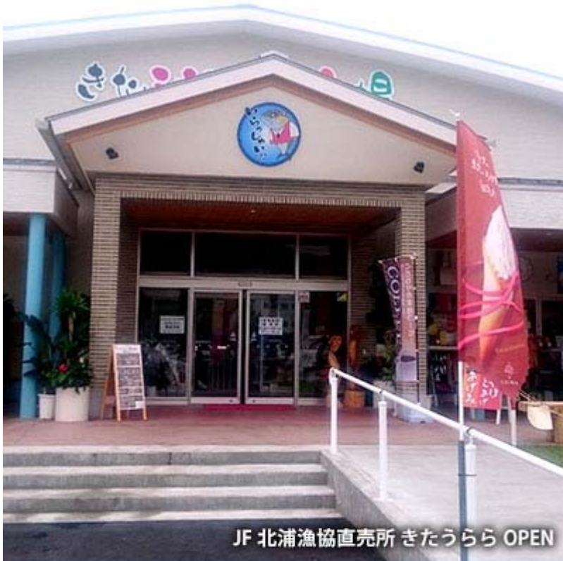
JF 北浦漁協直売所 きたうらら OPEN