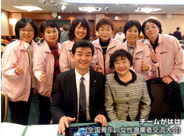
チームがはは (全国青年・女性漁業者交流大会)