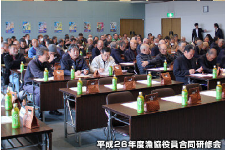
平成26年度漁協役員合同研修会