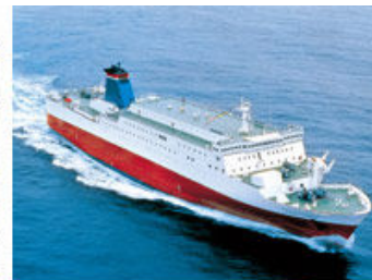
宮崎カーフェリー(株)