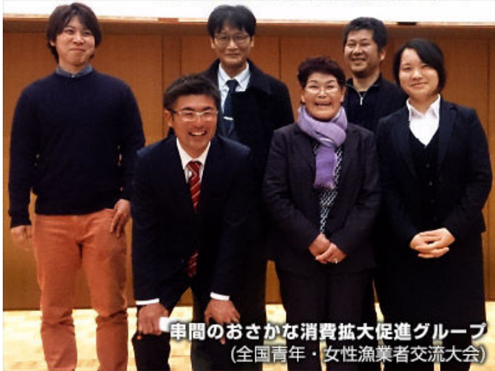
串間のおさかな消費拡大促進グループ (全国青年・女性漁業者交流大会)