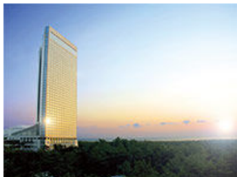
シェラトン・グランデ・オーシャンリゾート