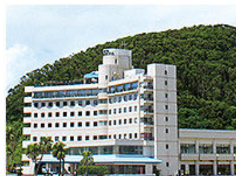
ホテルシーズン日南