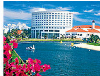
ANA ホリデイ・イン リゾート 宮崎