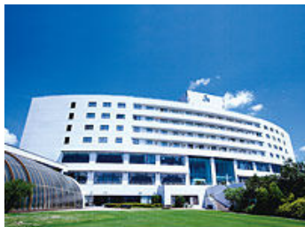
ホテルジェイズ日南リゾート