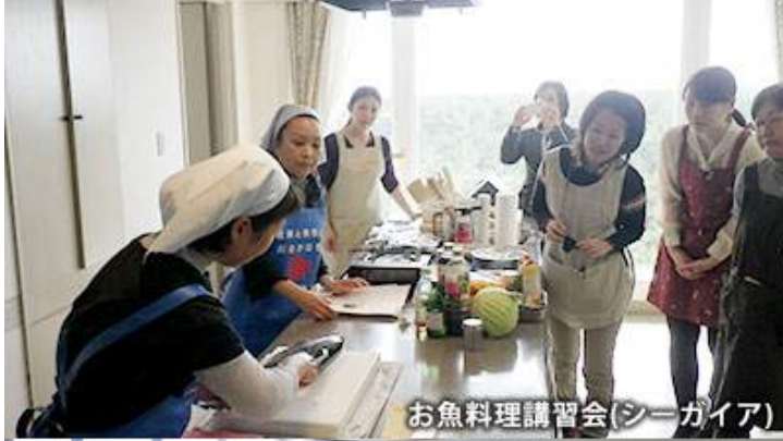
お魚料理講習会(シーガイア)