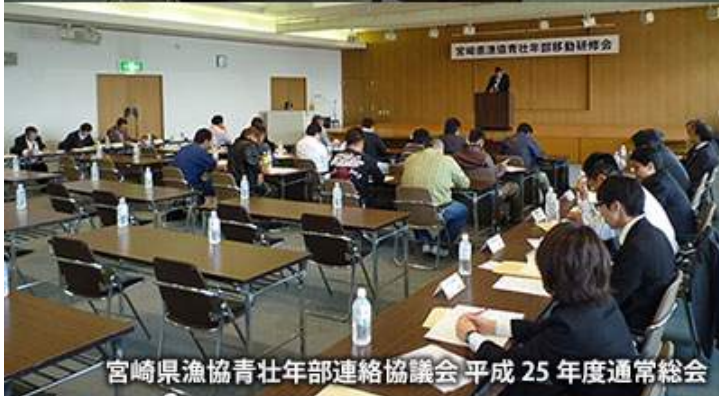
宮崎県漁協青壮年部連絡協議会 平成 25 年度通常総会