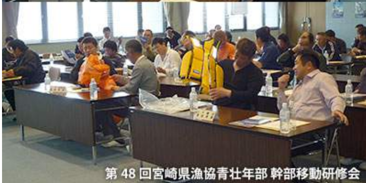
第 48 回宮崎県漁協青壮年部 幹部移動研修会