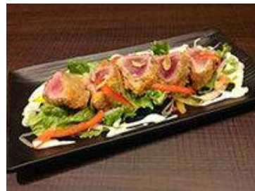
初かつおのレアカツ クリーミーわさびソース