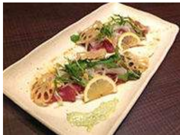
初かつおのガーリックカルパッチョ ジェノバ風