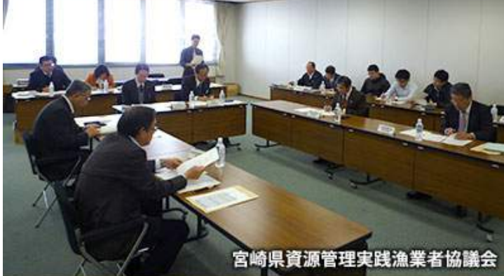
宮崎県資源管理実践漁業者協議会