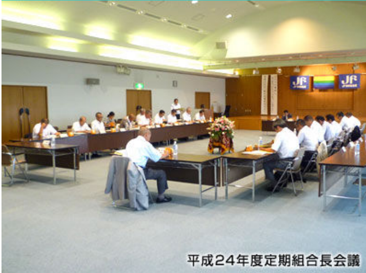
平成24年度定期組合長会議