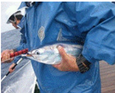
釣獲された標識用カツオ