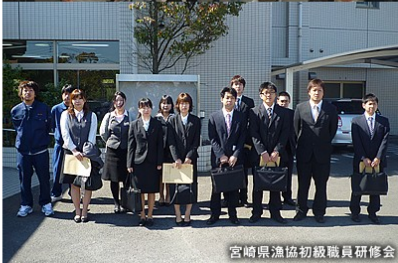
宮崎県漁協初級職員研修会