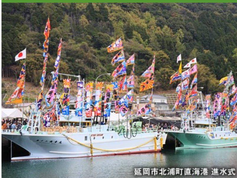
延岡市北浦町直海港 進水式