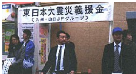
東日本大震災義援金募金活動