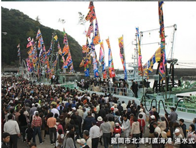
延岡市北浦町直海港 進水式