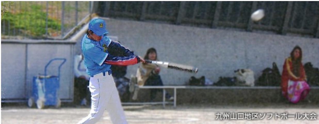
九州山口地区ソフトボール大会