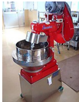
写真4 冷却式らいかい機