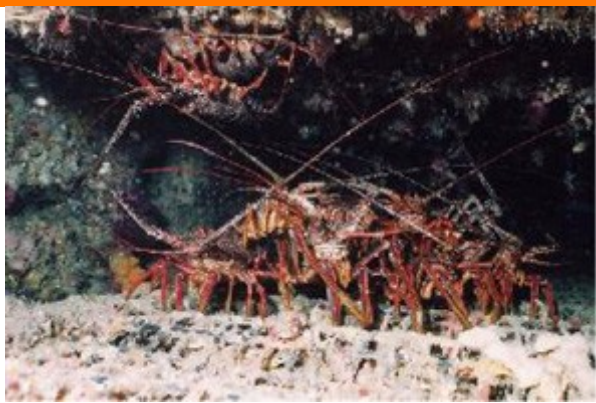
JFシェルナースに生息するイセエビ

シ ェルナース基質内の貝殻の重なりによる細かな隙間が、エビやカニ、ゴカイ類などの小動物の絶好の棲みかとなり、それを食べる魚を増やす増殖効果に優れています。また、基質の組み合わせによって様々な大きさ・形状の空間を形成し、カサゴやハタなどの幼稚魚、イセエビなどに隠れ場を提供します。