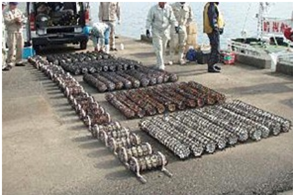
取り付けるシェルナース基質