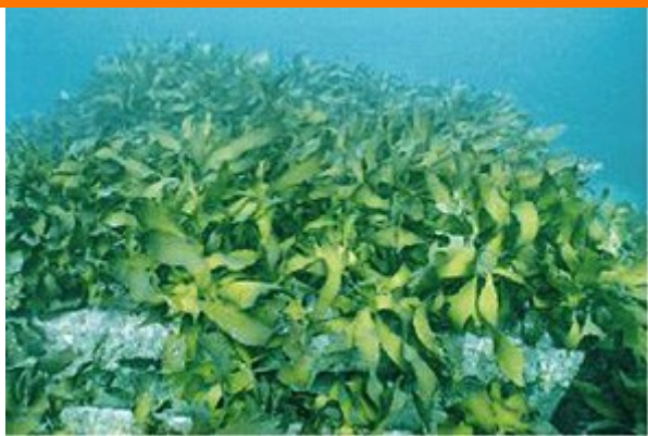
JFシェルナース上に形成された藻場(カジメ)

シ ェルナース基質は、アラメやカジメといった海中林をつくる海藻が根を絡ませてしっかりと着生できるため、波などの力で流失しにくくなっています。また、砂や泥などが表面にたまりにくいので、孢子等の付着が阻害されず持続的な藻場造成機能に優れています。