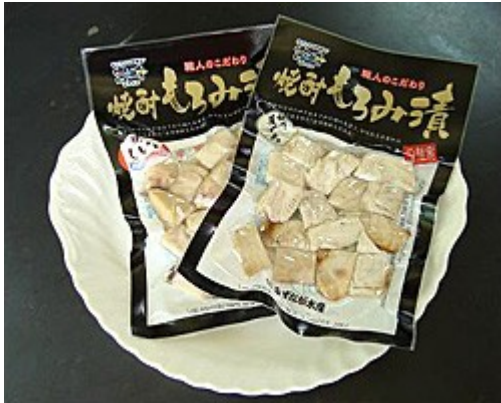
写真1 焼耐もろみ漬け

水産試験場は昭和45年に整備され、水産物加工指導センター（以下、「加工センター」）は食品加工業者等が自ら行う成分分析、加工実験等のために利用できる開放的な試験分析施設（オープンラボラトリー施設）として、昭和62年に改修されてから、多くの漁業関係者の方々に利用していただいています（表1）。しいらの焼耐もろみ漬け（平成20年度にブランド認証されています：写真1）、ヤマメの甘露煮、はもかまぼこやマリンコーラーゲンを含んだ石けん等商品化されているものもあります（表2）。