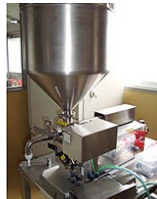
写真5 風船プリン製造機

これらの機械は、移動可能で、省スペースで利用できるため、規模の小さな加工業者でも導入可能となっています。ぜひ、加工センターで新しい機械を使ってみてください。そして、経営改善のための一助にさせていただき、新たな加工品づくりに役立てていただきたいと思います。