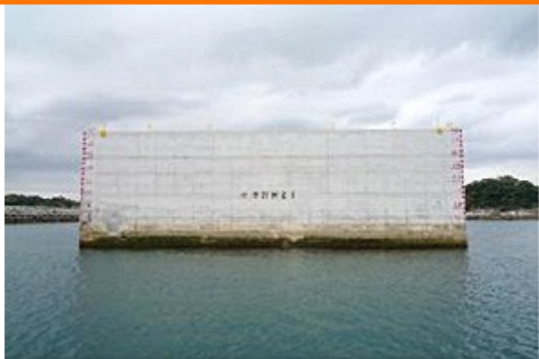
対象となるケーソン

平 成22年3月に日向市細島港内に仮置きされているコンクリートケーソン(沖防波堤用)に、5種類のシェルナース基質を取付け、港湾や漁港での効果を調べる実験を開始しました。海洋構造物の垂直面に基質を取付ける試みは全国で初めてになります。垂直面に生物の生息場所を創出することで、港湾や漁港内部の生態系の底上げを図り、水産資源の増産、生物多様性の向上、環境改善の可能性を検証します。