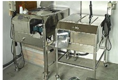
写真2 フィレマシン

手作業の負担が軽減されます。また、最近は寿司ネタ用としてフィレにして流通する商品が出回っていますので、特に需要がある機械です。