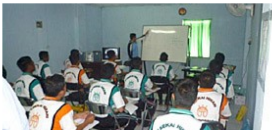
現地マンニングの関係