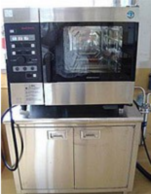
写真3 スチームコンベクションオーブン

もとはプリンや羊羹、ゼリーを作る機械ですが、これを利用し、コラーゲンボールやゼラチン商品を試作したいと思っています。