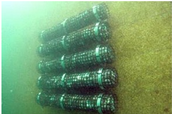
垂直面に取り付けたシェルナース基質